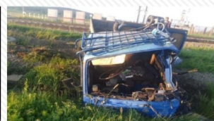
28 июня 2022 г. перегон Тайдут – Могзон