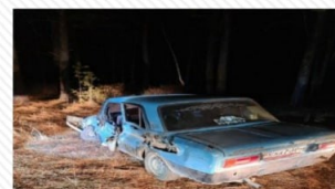
24 октября 2022 г. перегон Усть Пера – Ледяная