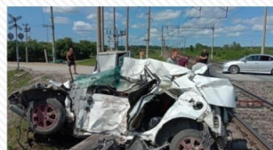
20 июля 2022 г. перегон Украина – Белогорск