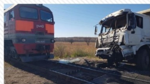
7 октября 2022 г. перегон Буряя – Амурская