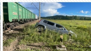
7 августа 2022 г. перегон Бушулей – Жирекен