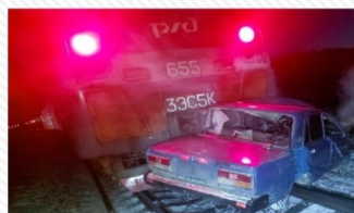
16 января 2022 года станция Сбега